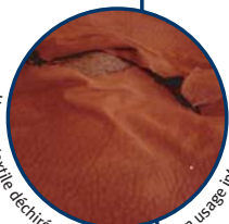
Housse textile déchirée, conséquence d'un usage intensif