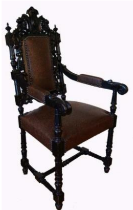
Photos 3 : Certificat de travail de sièges du 13/09/1869 et siège correspondant

Aujourd'hui, cette production s'exporte à l'international pour l'aménagement de villas de milliardaires, de yachts, de palaces, de restaurants gastronomiques, d'opéras ou de théâtres... Faisant écho aux manufactures royales, elle répond aujourd'hui comme par le passé aux exigences de beauté et de perfection les plus nobles. L'histoire du siège, c'est l'histoire de ces artisans menuisiers en siège, tourneurs, toupilleurs, tapissiers, sculpteurs, vernisseurs... et de l'excellence de leurs gestes. La transmission de ce savoir-faire ancestral propre au Bassin de Liffol-le-Grand s'appuie sur le Centre de formation pour Apprentis AFPIA Nord-Est. Ancré sur un territoire réputé pour son savoir-faire, le Centre forme des apprentis et des salariés aux métiers de l'ameublement, de l'agencement et de la décoration.