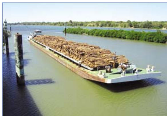
Un convoi poussé accoste au quai de l'usine de pâte de Tarascon : le transport fluvial peut être une alternative intéressante à la route et au rail.

Aujourd'hui, l'usine TEMBEC Tarascon considère que, pour ses approvisionnements originaires du nord-est de la France, la voie fluviale peut se substituer partiellement à une offre de transport par rail en régression.