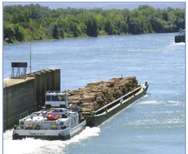
La France dispose d'un réseau fluvial très important.

Le transport par voie fluviale est une réelle alternative à la route et au rail. Il mérite à ce titre que l'on s'y intéresse de près.