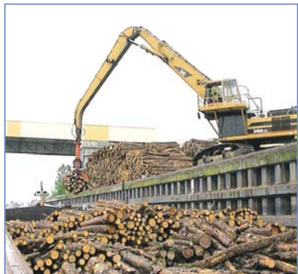
Chargement d'une barge de bois à Chalon-sur-Saône (71).

Les ports offrent de nombreux services susceptibles de séduire le secteur forêt-bois comme des capacités de stockage et de manutention, la possibilité de peser les produits, des accès faciles, etc... Les investissements nécessaires pour leur permettre d'assurer la manutention des bois sont modestes et ils peuvent donc très rapidement proposer un environnement multimodal (route/fleuve, fer/fleuve) intéressant pour la filière bois. Différents flux de produits forestiers pourraient ainsi transiter par ces plates-formes logistiques et bénéficier d'une interface pour les frets retour : par exemple pour les bois et les vieux papiers ou pour les bois et la pâte à papier.