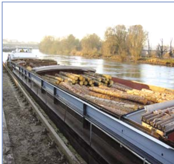
Les bateaux de gros gabarit, automoteurs (ci-dessus) ou barge + pousseur (photo en page 1) ont des capacités supérieures à 1000 tonnes.

2 - Des unités de plus fortes capacités, de 1500 à 3000 tonnes se présentent sous la forme de convois poussés (1 à 4 barges et un pousseur) ou d'automoteurs. Ces matériels ne peuvent circuler que sur les voies à grand gabarit.