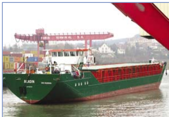
Ce caboteur fluvio-maritime peut transporter plusieurs milliers de tonnes sur fleuve et sur mer.

3 - Les caboteurs fluvio-maritimes sont capables d'emprunter le réseau fluvial et la mer. Les ports de la Méditerranée, de l'Afrique du Nord et de la façade occidentale de l'Europe peuvent ainsi être desservis au départ de certains ports intérieurs français. Quatre bassins peuvent accueillir ce type de bateau en France : le canal de Dunkerque à