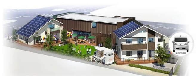
Photo : 6 "Smart Wellness Pavilion" de NICE corporation situés à Yokohama

Un des objectifs d'une éventuelle collaboration entre le FCBA et les industriels et laboratoires japonais serait de lier le ressenti subjectif avec des données objectives à travers le montage d'un projet de recherche et/ou l'accueil d'un post-doc issu d'un laboratoire japonais au sein de FCBA : cela passe par une meilleure compréhension des caractéristiques physiques du bois utilisé en revêtement intérieur et/ou du mobilier (effusivité, capacité à réguler l'humidité de l'ambiance intérieure, propriétés d'absorption acoustiques, qualité olfactive...). Une étude liée à la prise en compte de plusieurs essences et de différents revêtements pour arriver à des solutions optimisées vis-à-vis du confort intérieur multicritère pourra être menée.