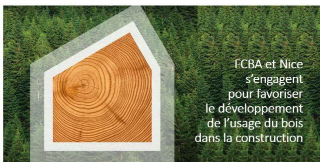
Signature du Mémorandum d'Entente entre l'Institut technologique FCBA et le groupe japonais NICE Corporation Grand Forum de l'Année de l'Innovation franco-japonaise - 6 décembre 2016 à Osaka