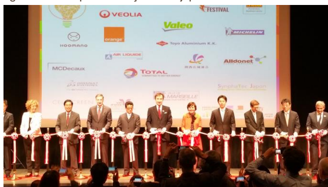
Photo 3 : Grand forum de l'Année de l'innovation franco-japonaise à Osaka, Japon – 6 & 7 décembre 2016

Le travail de collaboration s'est prolongé du 2 au 9 décembre 2017 à Tokyo et Osaka lors d'une mission bois construction France / Japon qui a réuni de nombreuses collectivités françaises accompagnées de délégations d'entreprises, de chercheurs, de clusters, de start-ups et des plus grandes entreprises françaises et japonaises.