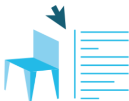
Figure 5 : L'objet BIM doit contenir l'ensemble des données et propriétés le caractérisant

Les demandes de produits sous forme d'objets numériques paramétriques sont encore peu nombreuses , mais des acteurs du secteur de l'ameublement ont choisi d'anticiper les futures demandes, en se dotant de logiciels leur permettant de convertir leurs catalogues produits sous cette forme .