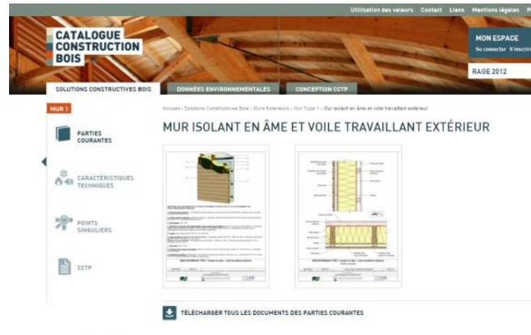
Figure 1 : Vue d'une page de partie courante

Cette première version sera complétée au deuxième trimestre de cette année par une deuxième partie sur les ouvrages (maisons individuelles, bâtiments collectifs et façades ossature bois).