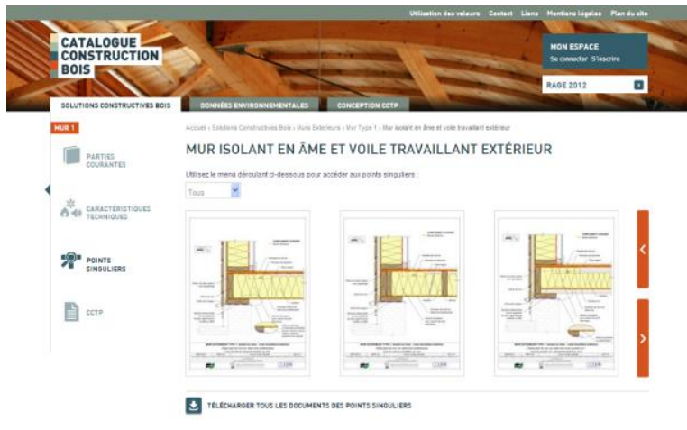
Figure 2 : Vue d'une page de points singuliers