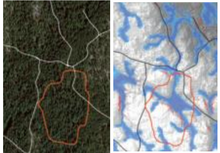
Scéma 2 : exemple de visualisation du risque humidité (sol détrempé) dans l'outil WAM (Wet area map) en cours de développement chez le partenaire Skogforsk