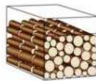
... et plus que 0,70m 3 si les bûches sont coupées en 0,33m