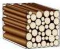
Le stère initial en bûches de 1m de longueur occupe par définition un volume de 1m 3