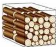
Il n'occupe plus que 0,80 m 3 si les bûches sont coupées en 0,50m