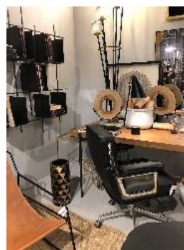
Ambiance de chez Thai natura