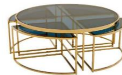
Design award CovetED