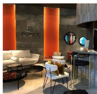
Ambiance du stand Duistt