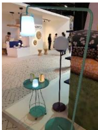
Table basse et luminaire Fermob

Quelques visuels non exhaustifs bien sûr ! Pour plus de détails sur les labellisés