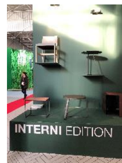
Table et siège de Interni Edition