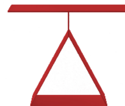
Table de chez Zens lifestyle europe BV