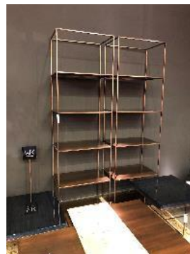
Etagère Inspired ltd