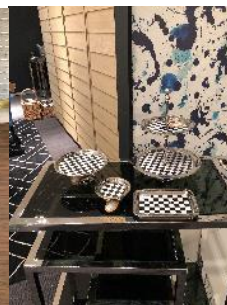
Fancy home collection