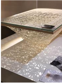
Table en impression 3D de Imprime-moi un mouton .