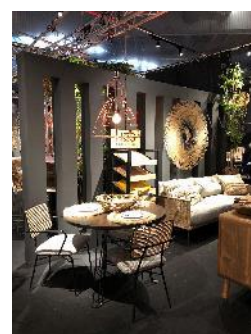
House of Saak