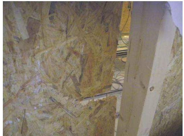
Photo 2 : Rupture du panneau de contreventement suite à un choc à 900 J

En sachant que quoi qu'il en soit des réparations devront être entreprises par le maître d'ouvrage, deux cas peuvent être envisagés: