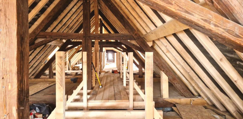
▲ Maddalon Frères