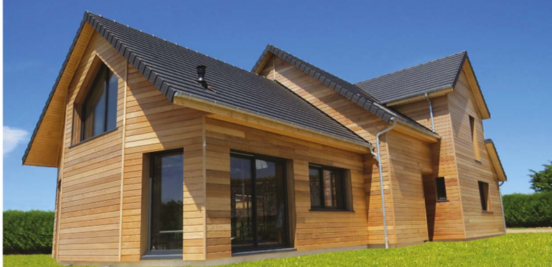
▲ Maison Maugy